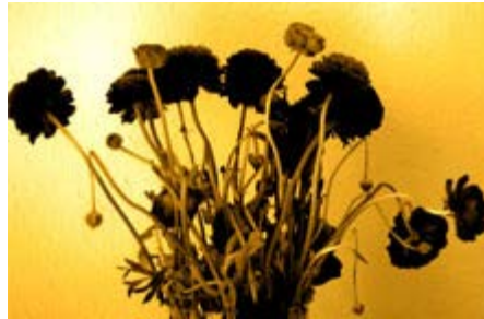
נוף זהוב עבודה של איתן בוגנים

תמיד כשאני מבקרת ב גלריה האוניברסיטאית , ויש להודות שאני לא מבקרת בה הרבה, עולה בי תחושת החמצה. לא ברור למה הגלריה לא הפכה להיות חלל מרכזי ומשמעותי יותר בשדה האמנות. המיקום באוניברסיטת תל אביב מאפשר גישה לצופים צעירים, שלא בהכרח מסתובבים במסלול התערוכות הקבוע, אך בוודאי היו יכולים להתחבר למהלכים שונים ופחות שגרתיים בעולם האמנות. אבל החלל המרשים המשלב תאורה טבעית ומלאכותית וחללים גדולים, שאפשר גם להציג בהם יצירות אינטימיות, כמעט לא עורר עניין או תשומת לב מיוחדת. וחבל. מן הסתם נוכחותו רבת השנים של פרופ' מוטי עומר כיוונה למקום מסוים שאינו בהכרח ניסיוני. במקום למדו תלמידי קורס האוצרות של האוניברסיטה, ובניגוד לתערוכות המסקרנות של הסטודנטים מסמינר הקיבוצים, אף פעם לא שמעתי על תערוכות שהם אצרו. עוד דוגמה לפספוס החלל.