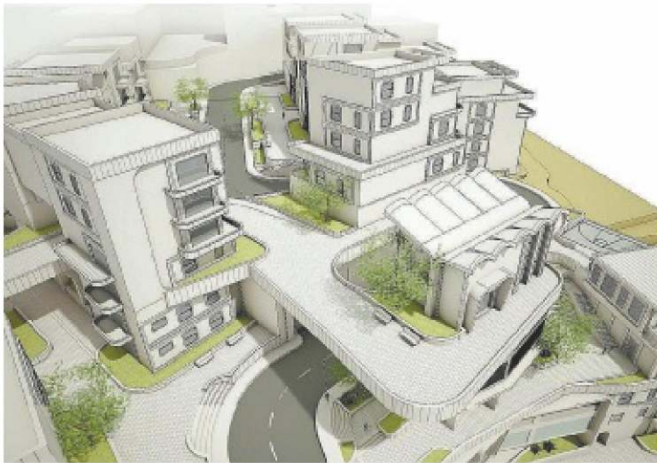
מתוך הפרויקט של שלמה שטראוס. צורת התיישבות חדשה