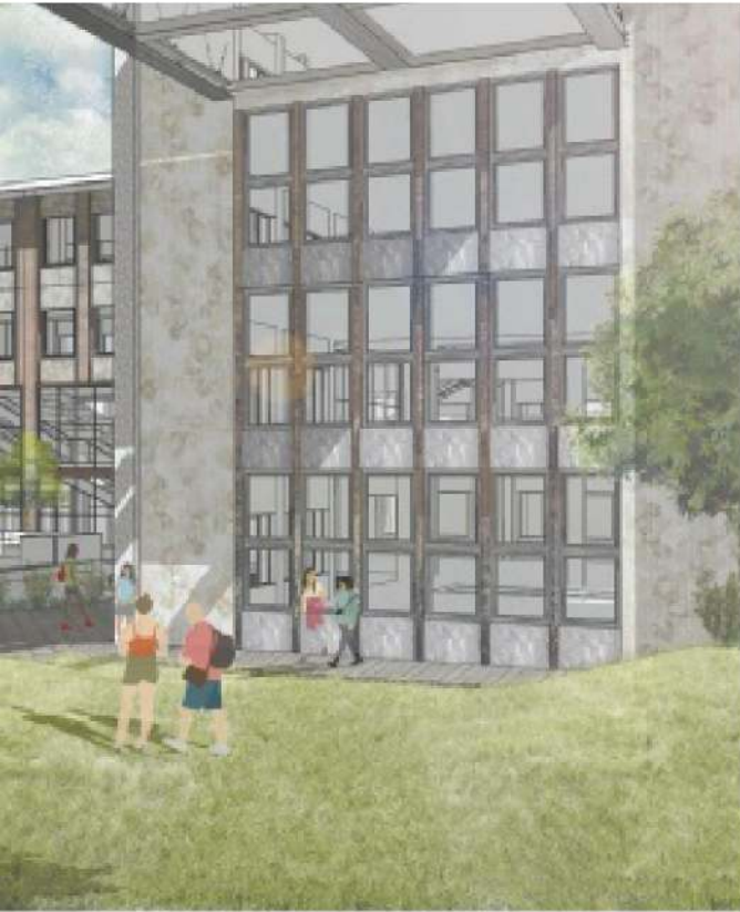
מתוך הפרויקט של אסף שוקרון. קמפוס עירוני במתחם שמויעד לפינוי בינוי