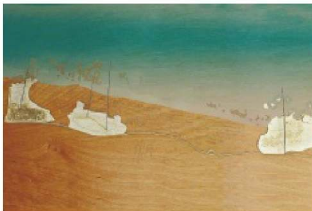
מתוך הפרויקט של מייס עבדולחיי. העצמה נשית