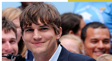
החברים מפ"ת שגייסו מיליונים מאשטון קוצ'ר