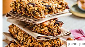
רעבים אחרי אימון? מתכון לחטיף בריאות עשיר בחלבון danone