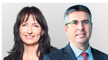
המיליונים שעברו גילוי מרצון לא יכולים להיכנס לישראל