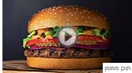
רוצים לדעת איזה המבורגר הצטיין בבדיקות המעבדה? ערוץ 10