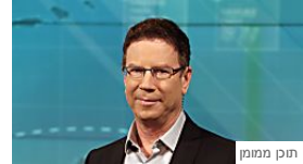
לילה כלכלי - אחד הסייטים הגדולים של כל הורה הוא למצוא... Facebook | Facebook Welcome to Facebook! | Facebook