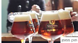
איטית, אבל קנתה אותנו מהר: בירת גולדסטאר SlowBrew החדשה Time Out