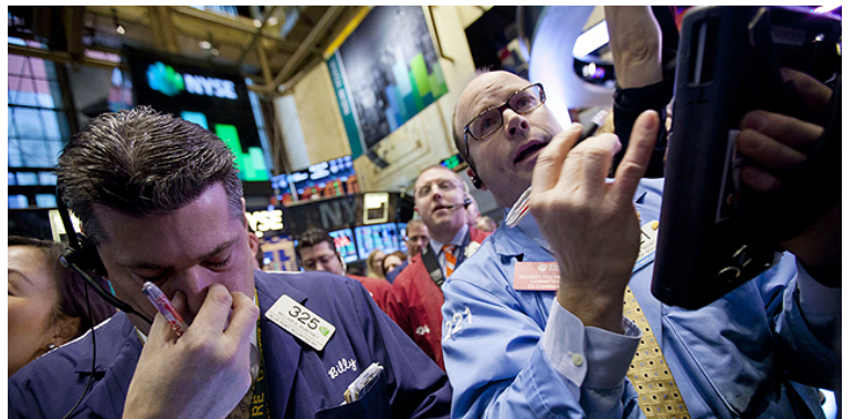
היסטוריה בוול סטריט: מדד דאו ג'ונס מעל רמת 20 אלף הנקודות