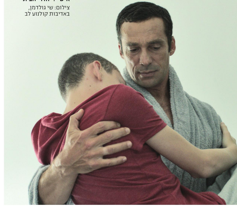
"הקושי הכלכלי בסרט הוא משל לכישלון אישי." "חדרי הבית"

התחלה חדשה, והניסיון לא מסייע. ההת-רגשות אותה התרגשות, המתח אותו מתח והשאפה לבצע את התסריט באופן הטוב ביותר ואחר כך להוביל את הסרט המוכן אל המסך באופן הטוב ביותר שא-פשר - מעסיקה אותך באינטנסיביות.