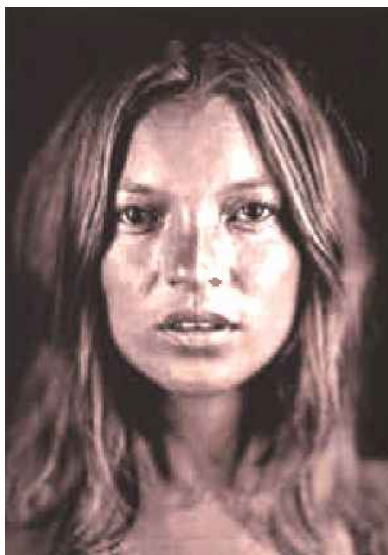
עבודות של צ'אק קלוז, יוסוף קארש ורוברט מייפלט'ורפ. בליל כיפי של פורטרטים

האפשרות שהם נותנים לנו להתבונן ישירות בפני אדם אחר, מבלי שיצט"ך להחזיר לך מבט. הרי כולנו נהנים לבחון את מי שלצרנו, וזו ללא ספק אחת ההנאות בתערוכה.