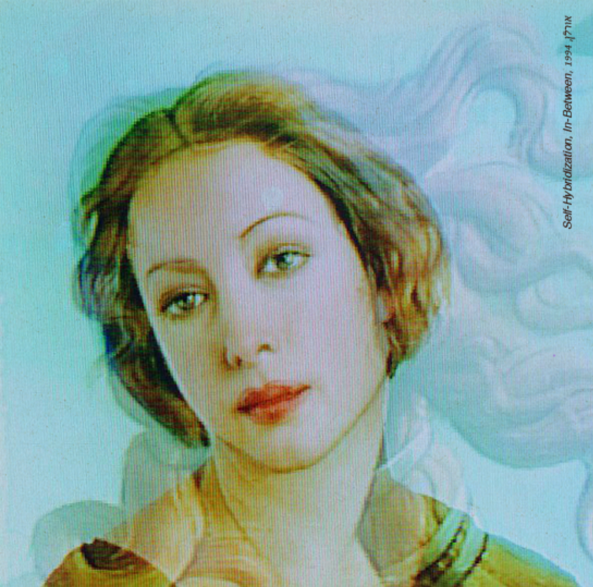
אורלן, 1994, In-Between, Self-Hybridization