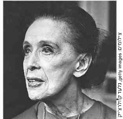
מרתה גרהם. ליווי אמנותי בתחילת הדרך

ביום. כבן 22 אני מרגיש בר-מזל שאני יכול להשתכר ולחיות חיים טובים באמצעות מה שאני מרוויח. אפשר גם לדגמן ולעשות פרסומות, ומוצאים דרך למלא את החסר. הבעייתיות מתחילה בשלב מאוחר יותר, ולהיות אמא בלהקה זה כמעט בלתי אפשרי, כי אנחנו עוברים פה באינטנסיביות כל היום". היו גם ציפורים כמו מסאו'יסט צמוד? רינה: "הלוואי. היתה תקופה שבה