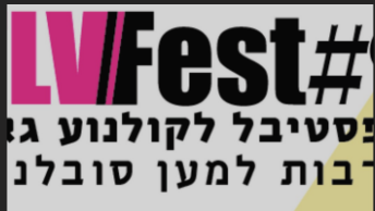
מבט קדימה אל עונת פסטיבלי הקולנוע של קיץ 2014 ב-"פסטיבלים"