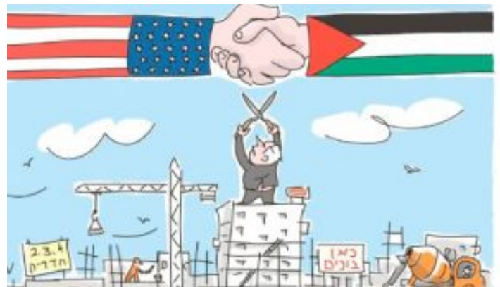
מלכות מדינית מתוחכמת | הקפין של נתניהו חגית עופרן | 52