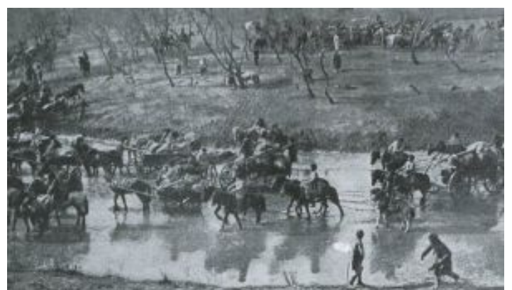
התבוסה הרוסית ששימחה את היהודים בן עמי שילוני | 13