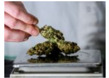
צה"ל מתכנן להקל עם חיילים שעישנו סמים