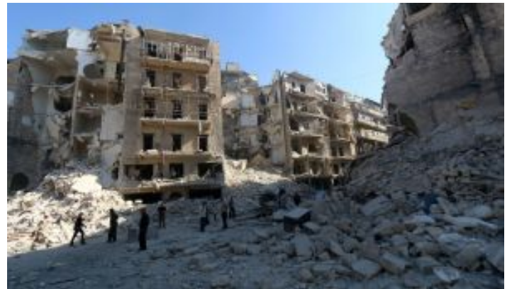
דאעש קרוב לניתוק חאלב, אסד במתקפה הקטלנית של השנה ג'קי חורי, רויטרס | 19